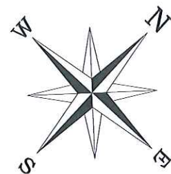
Plano de Situación Escala 1/6.000